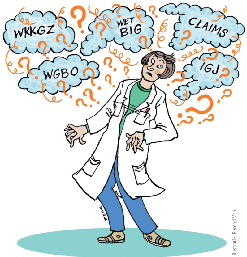
Illustratie: Berend Von

Laten we het een positieve uitdaging voor het veld noemen. Een uitdaging die VvAA het komende half jaar in ieder geval aanpakt, met onder meer de ontwikkeling en introductie van een serie nieuwe praktische lezingen. Dit in het verlengde van de activiteiten tijdens de introductie van de Wkkgz. >